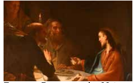
Emmaus-Begegnung im Matura-saal des Stiftes, Kremser Schmidt

Ich wünsche uns allen ein Ostern mit brennenden Herzen!