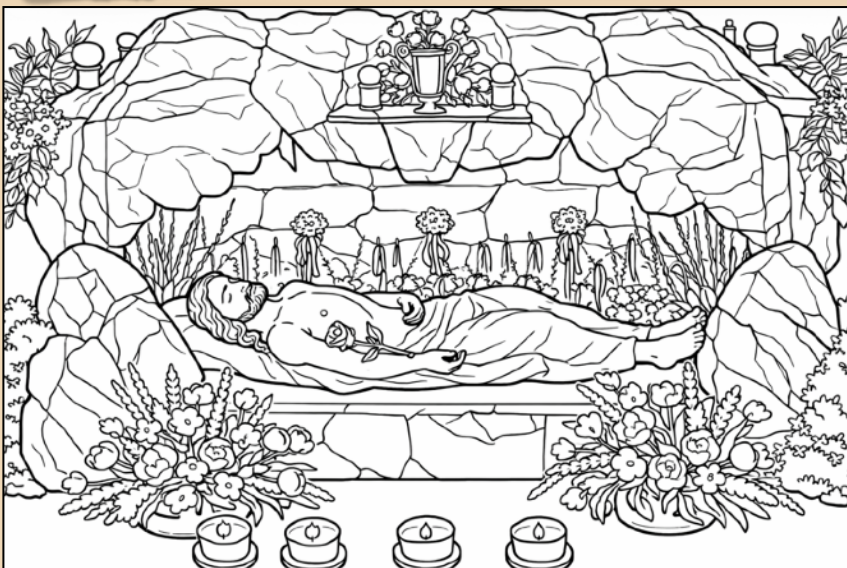
„Heiliges Grab“ in der Stiftskirche Seitenstetten - Ausmalbild mit KI erstellt.

Denn Ostern ist Leben. Ostern ist Hoffnung. Ostern ist Liebe.